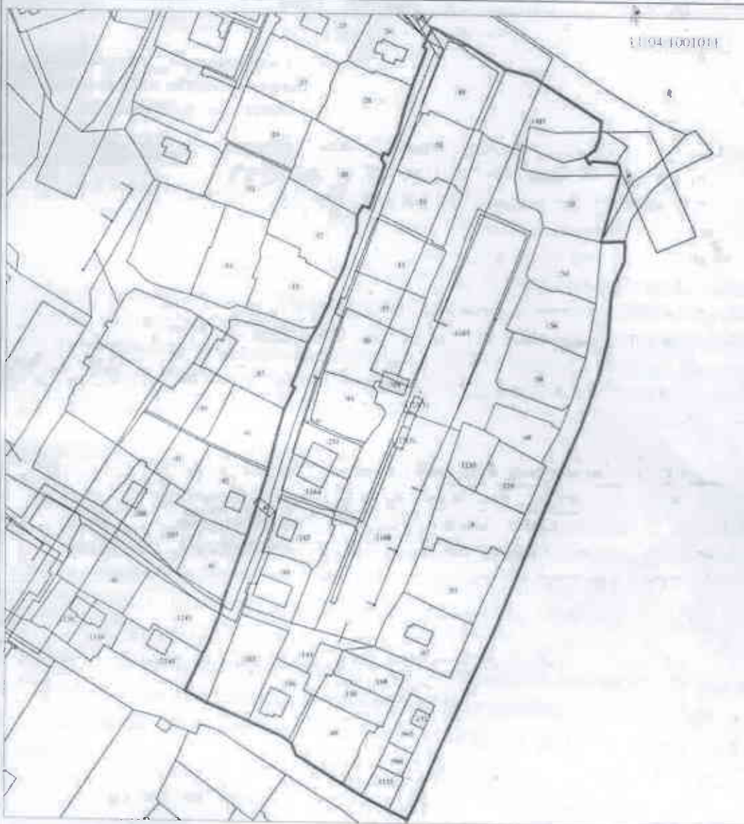
Схема границ элемента планировочной структуры