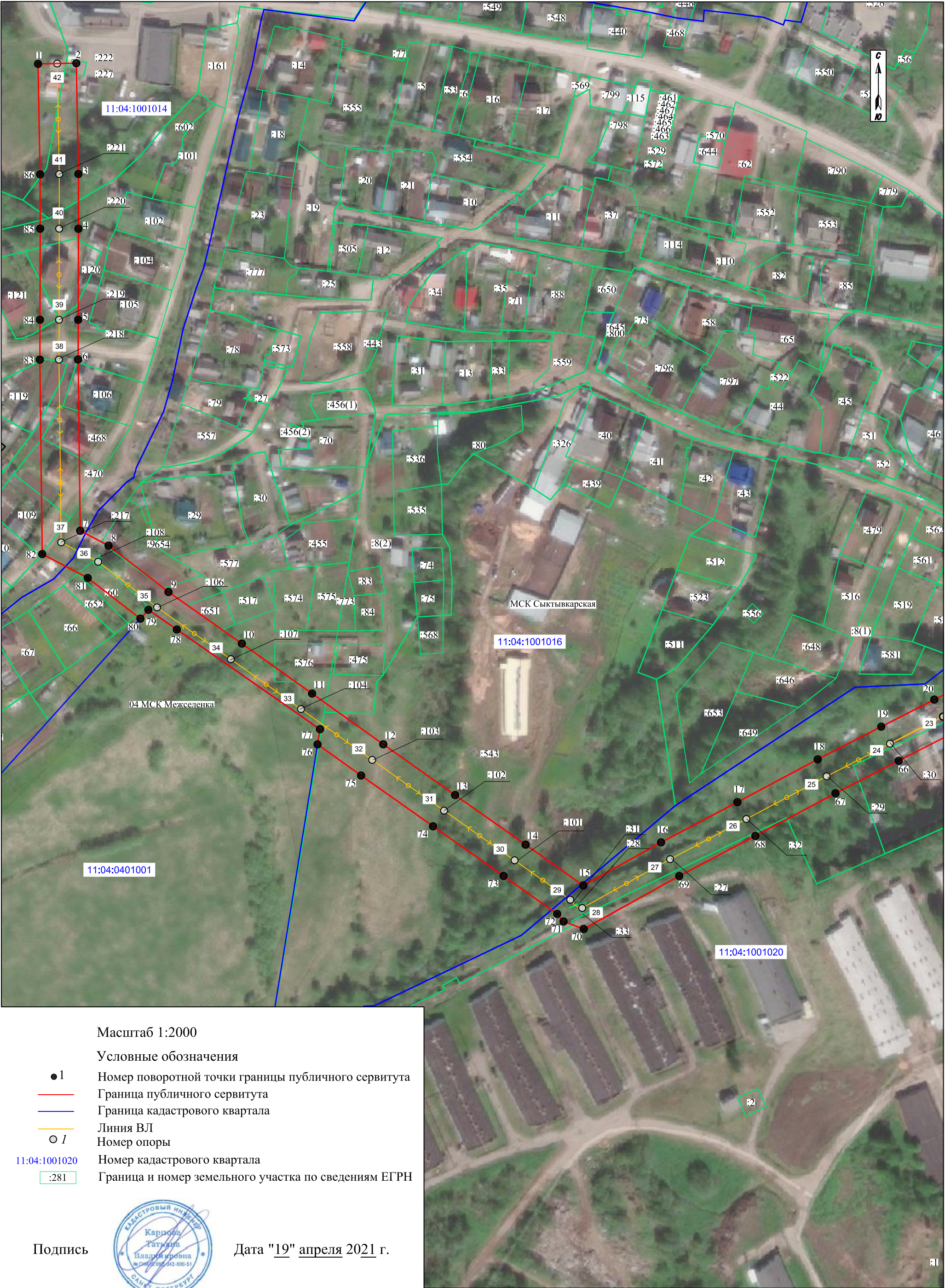
Схема расположения границ публичного сервитута: воздушный вывод с ПС 110/10 кВ «Вильгорт» яч.14 на ВЛ-10 кВ от ПС 110/10 кВ «Вильгорт» - ТП-962