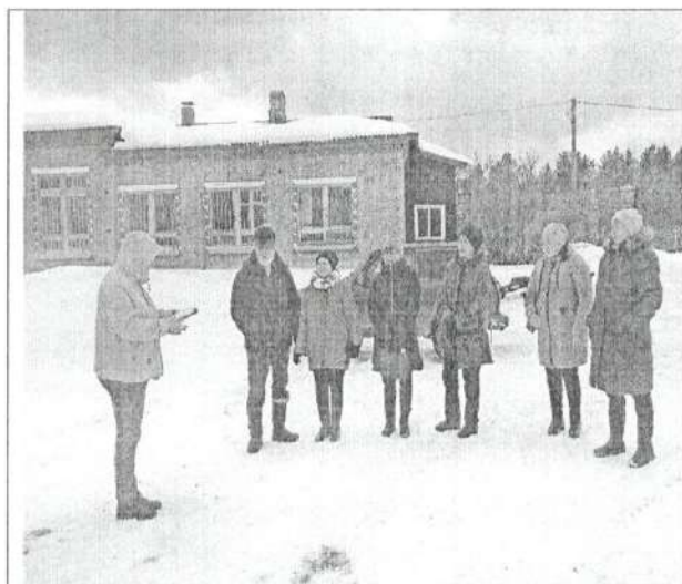
Фото участников собрания от 31.03.2022 г.